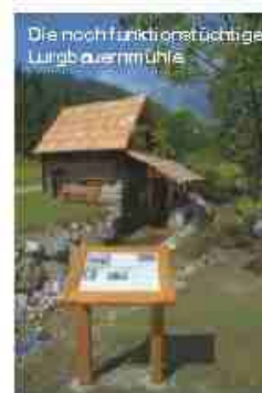
Die noch funktionstüchtige Lungbäuerinnenhütte